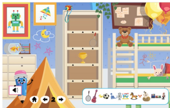
Εικόνα.3 Επίπεδο 2 της εφαρμογής

Στη δεύτερη φάση της δραστηριότητας διδασκαλίας, ο/η εκπαιδευτικός μεταβαίνει μαζί με τα παιδιά στο δεύτερο επίπεδο του λογισμικού (εικ. 3). Εξηγεί στα παιδιά ότι «ο μικρός Νικόλας» θέλει να βάλει τα παιχνίδια του στις σωστές θέσεις, αλλά έχει μπερδευτεί τόσο πολύ που χρειάζεται τη βοήθειά τους. Η κάθε ομάδα ακούει τις προφορικές οδηγίες του κάθε παιχνιδιού και προσπαθεί να το τοποθετήσει στη θέση που υποδεικνύεται. Πριν προβούν στην τελική τους απόφαση, οι ομάδες έχουν ανταλλάξει ιδέες, έχουν διαπραγματευτεί για την πιθανή θέση και έχουν ακουστεί όλες οι απόψεις. Η άμεση ανατροφοδότηση από το λογισμικό δίνει τη δυνατότητα στα παιδιά να σκεφτούν το λάθος τους και να προτείνουν νέα θέση.