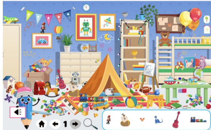
Εικόνα. 2 Επίπεδο 1 της εφαρμογής

για τη θέση του αντικειμένου, τόσο ανάμεσα στο παιδί και στο αντικείμενο όσο και ανάμεσα στα ίδια τα αντικείμενα (πχ ο στρατιώτης βρίσκεται πάνω από το κάδρο, μπροστά από τον τοίχο και στα αριστερά σου). Στη συνέχεια ζητά από τα μέλη της ομάδας να την επαναλάβουν, προκειμένου τα παιδιά να ασκηθούν στη διατύπωση των χωρικών όρων προκειμένου να τους ενσωματώνουν στο λόγο τους, ώστε να αφομοιωθούν πληρέστερα.