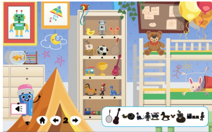
Εικόνα. 4 Τοποθέτηση αντικειμένων (επίπεδο 2 της εφαρμογής)

που επιλέγει. Τα παιδιά ανταλλάσσουν απόψεις ως προς τις περιγραφές που θα κάνουν ενώ σε περίπτωση λάθους ο/η εκπαιδευτικός δεν επεμβαίνει, αλλά επαναλαμβάνει τη δραστηριότητα σε άλλα πλαίσια.